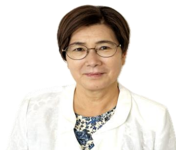
講師プロフィール

看護師として約40年にわたり医療現場に従事。在職中より「自分に出来る社会貢献とは何か」を模索し、地域に根ざしたボランティア活動を開始。